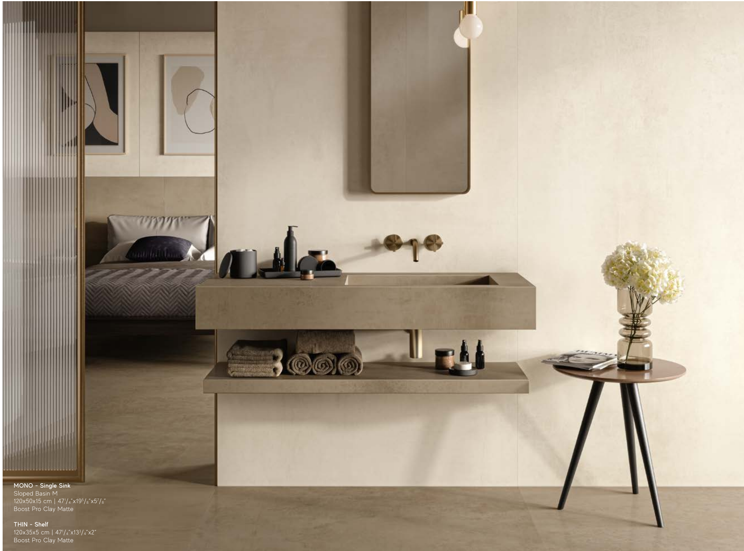
MONO - Single Sink Sloped Basin M 120x50x15 cm | 47 1/4" x 19 5/8" x 5 7/8" Boost Pro Clay Matte