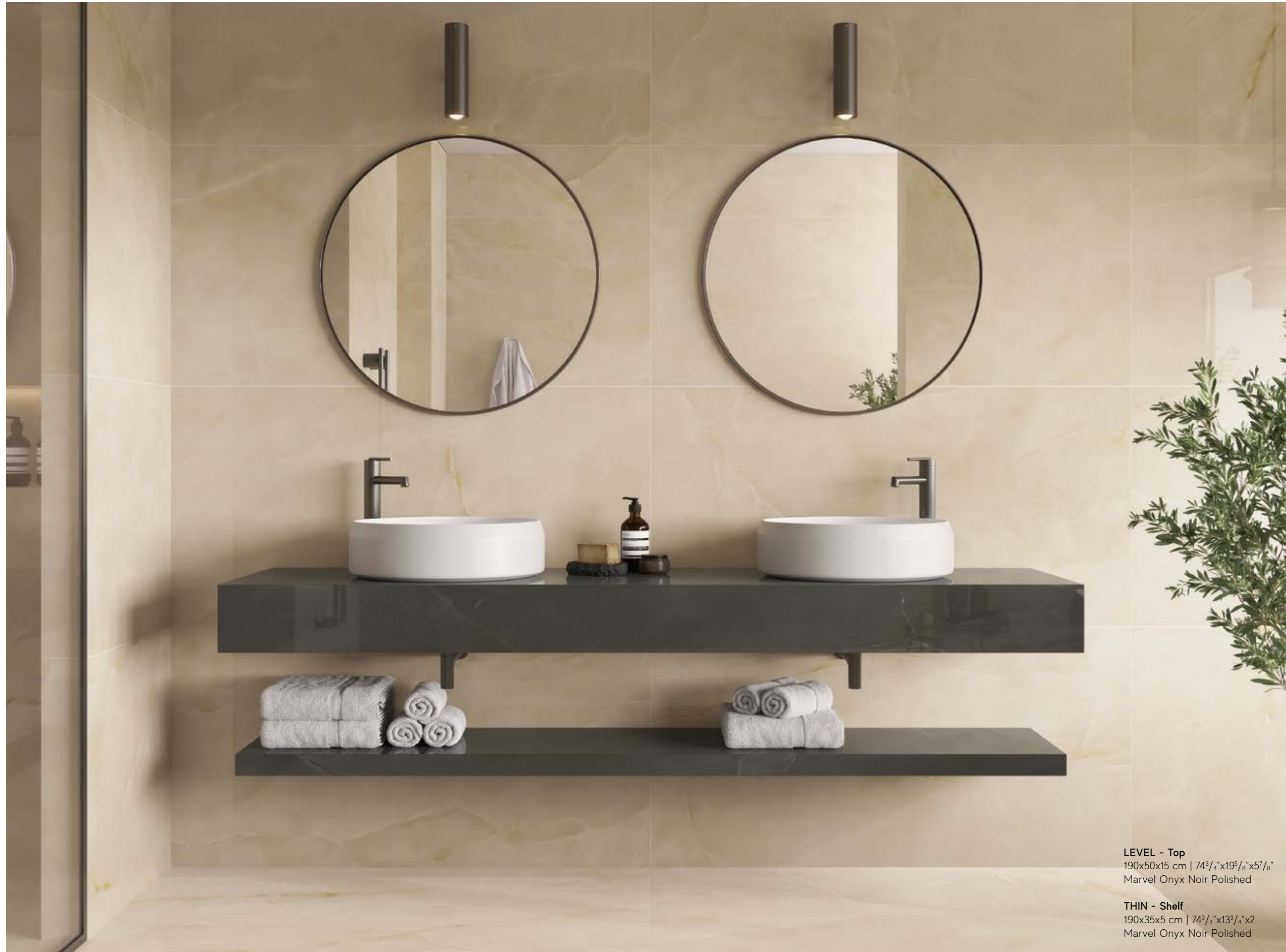
LEVEL - Top 190x50x15 cm | 74 3 / 4 "x19 5 / 8 "x5 7 / 8 " Marvel Onyx Noir Polished