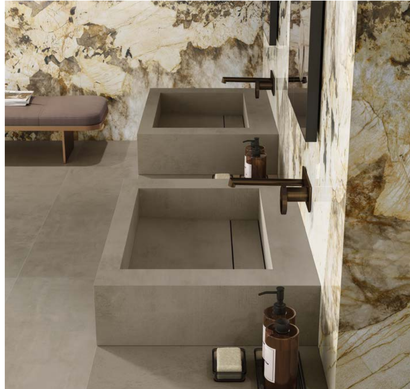
UP - Sit-on basin Flat Basin M 65x50x15 cm | 25 5 / 8 "x19 5 / 8 "x5 7 / 8 " Boost Pro Taupe Matte