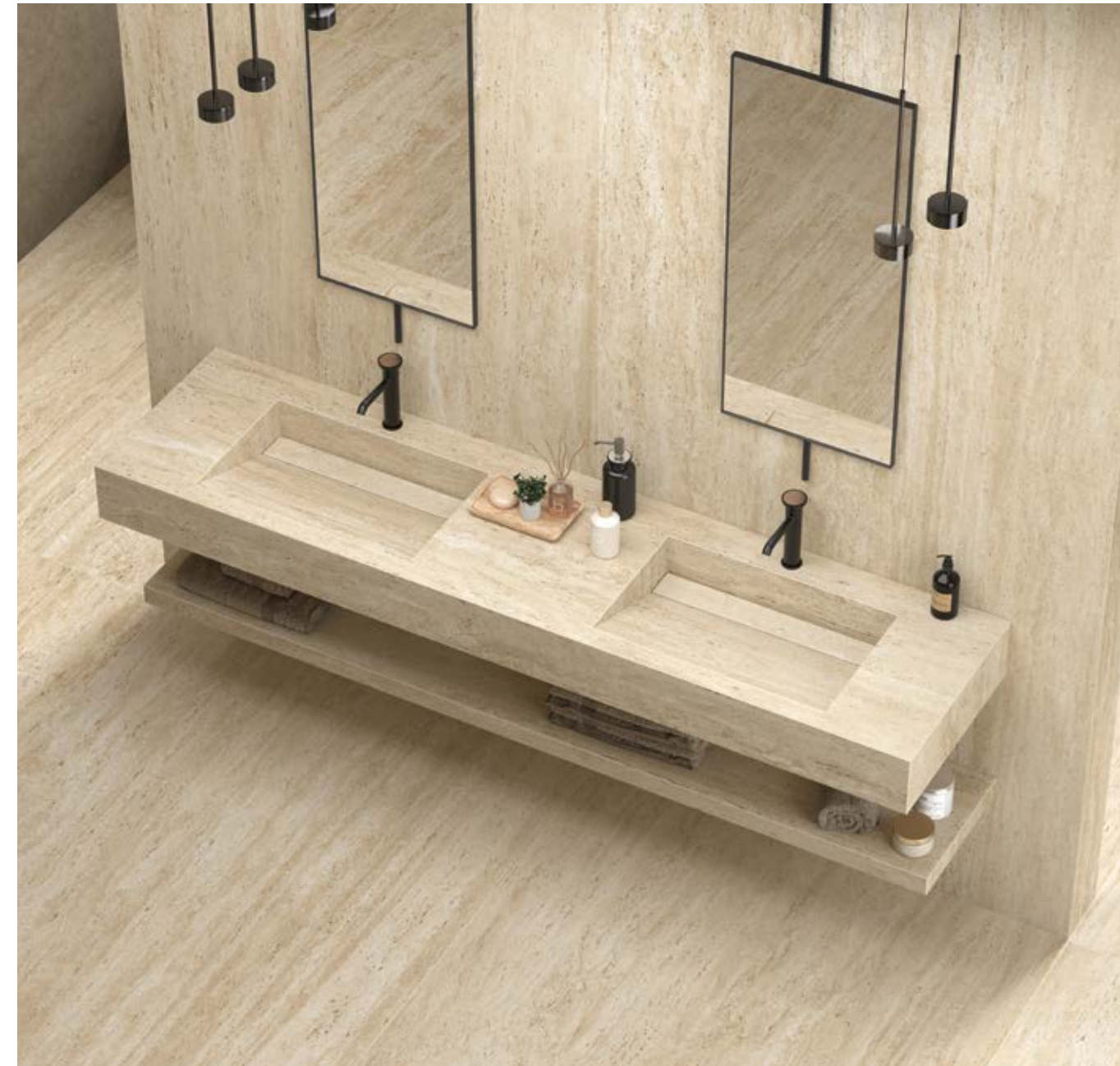
DUO - Twin Sink Sloped Basin M 210x50x15 cm | 82 5 / 8 "x19 5 / 8 "x5 7 / 8 " Marvel Travertine Sand Vein Cut Matte