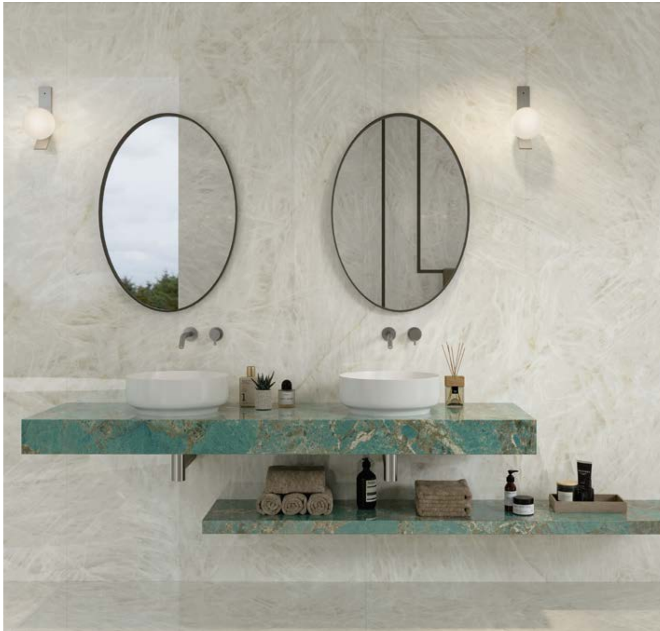
^ LEVEL - Top 180x50x15 cm | 70 7 / 8 "x19 5 / 8 "x5 7 / 8 " Marvel Gala Amazonite Polished