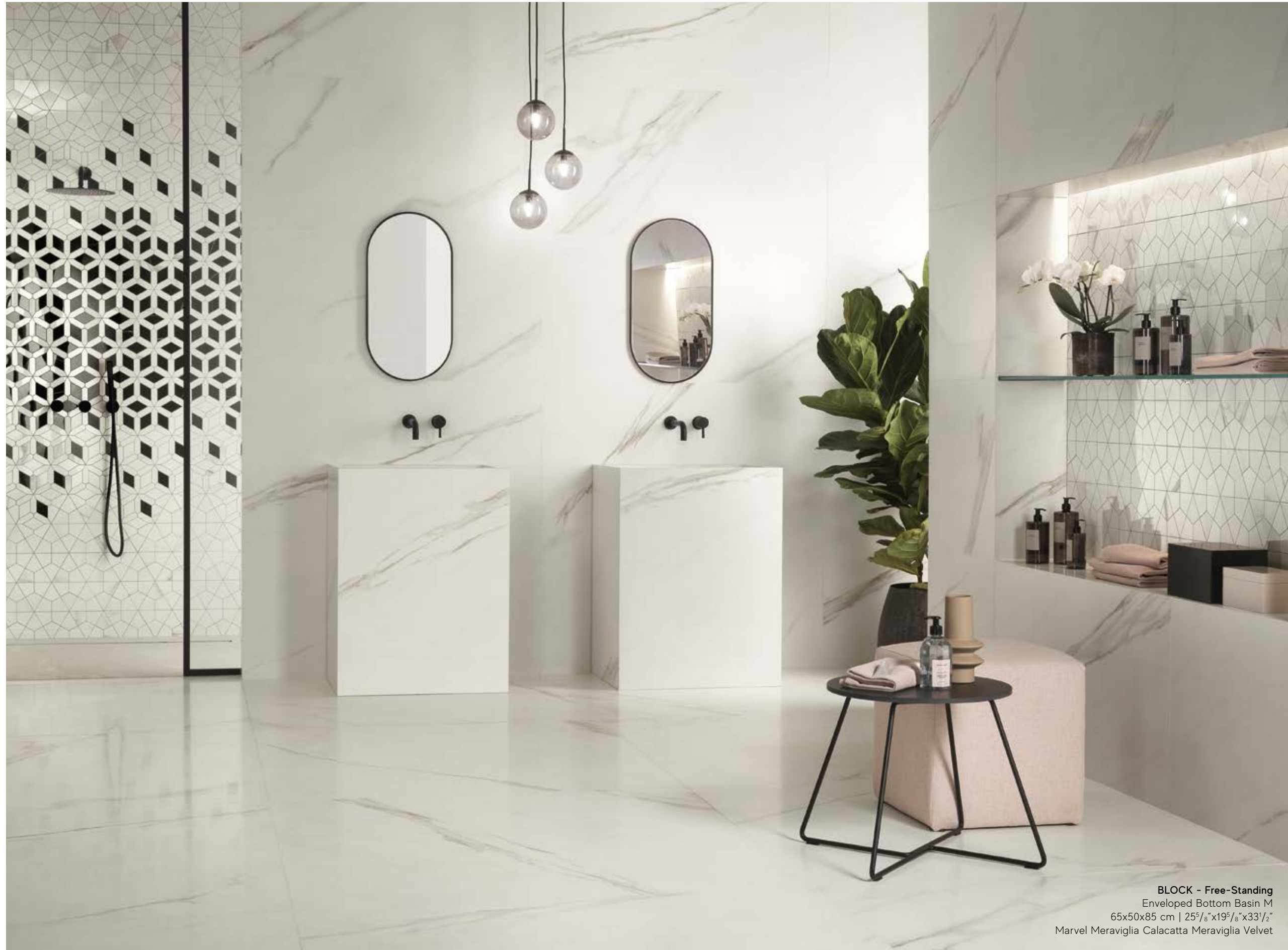
BLOCK - Free-Standing Enveloped Bottom Basin M 65x50x85 cm | 25 5 / 8 "x19 5 / 8 "x33 1 / 2 " Marvel Meraviglia Calacatta Meraviglia Velvet