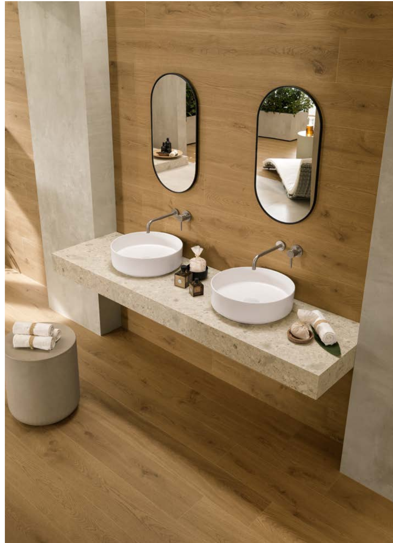
> LEVEL - Top 180x35x15 cm | 70 7 / 8 "x13 3 / 4 "x5 7 / 8 " Boost Mix Ivory Matte