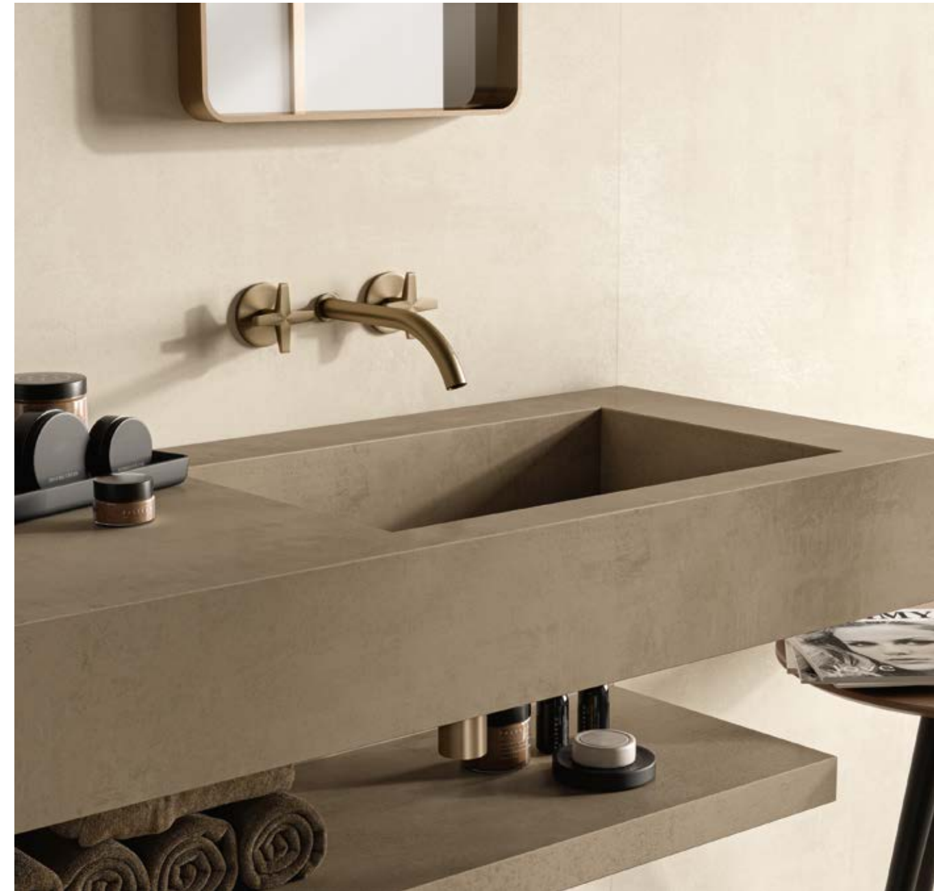
MONO - Single Sink Sloped Basin M 120x50x15 cm | 47 1 / 4 "x19 5 / 8 "x5 7 / 8 " Boost Pro Clay Matte